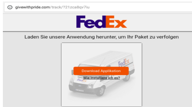
2. ábra: A Fedex-et megszemélyesítő káros weboldal